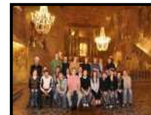
Szkolenie HERZ Wieliczka