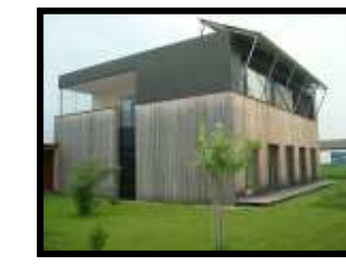
Budownictwo Pasywne Austria