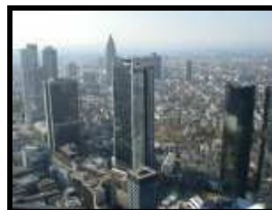
Targi ISH 2012 Austria