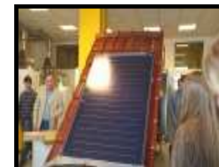
Kolektory słoneczne Junkers