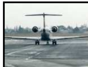
Budowa Terminala Ławica