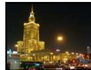
Wyjazd do Warszawy