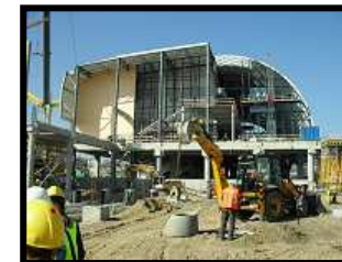
Budowa dworca PKP Poznań