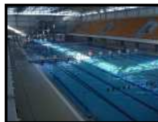
Termy Maltańskie Poznań